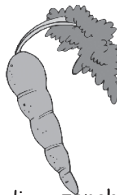
1 mediana zanahoria 2.2 gramos