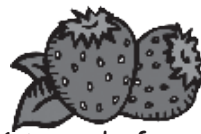
1 taza de fresas 3.4 gramos