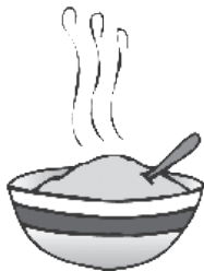
\frac{1}{2} taza de avena cocida 2 gramos