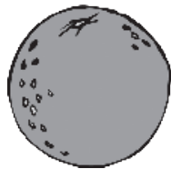
1 naranja mediana 3 gramos