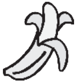
1 banana mediana 3.1 gramos

Niños, circulen los alimentos que contienen 30 gramos de fibra.