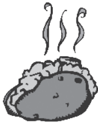
1 media papa horneada 4.6 gramos