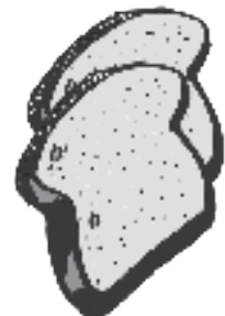
2 rodajas de tostadas o pan de trigo grano entero 3.8 gramos